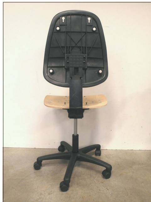
Vista da dietro