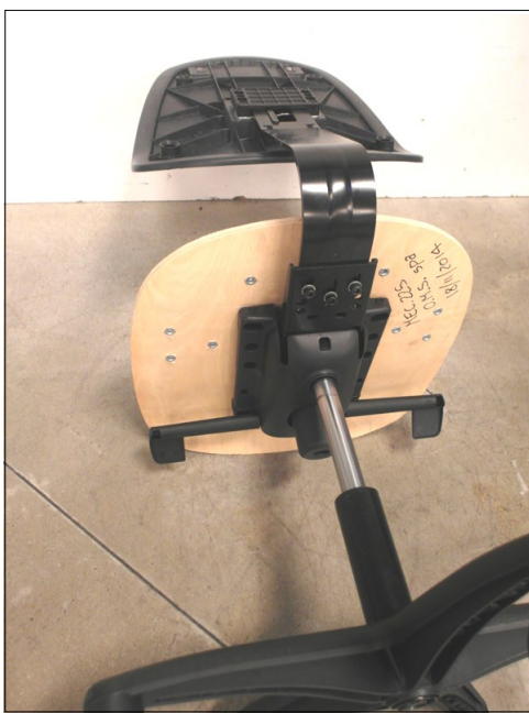
Vista da sotto